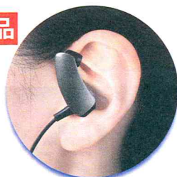
イヤホンパネル色: ダークグレー

販売名: おんわJ1 一般的名称: ポケット型補聴器 医療機器認証番号: 224AIBZX00043000